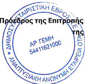
Καλακίκος Παναγιώτης Δήμαρχος Σουφλίου

Ο Πρόεδρος της Επιτροπής Διαχείρισης Προγράμματος Κεντρικού και Νοτίου Έβρου της Δημοσυνεταιριστικής Έβρος Α.Ε.